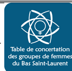
Table de concertation des groupes de femmes BSL

Ce Bulletin d'information a été rendu possible grâce à la participation financière du Programme À égalité pour décider, Secrétariat à la Condition féminine du Québec, du Programme Promotion de la Femme, Condition féminine Canada, de la Conférence régionale des élus du Bas Saint-Laurent et du Ministère des Affaires municipales, Régions et Occupation du Territoire (MAMROT).